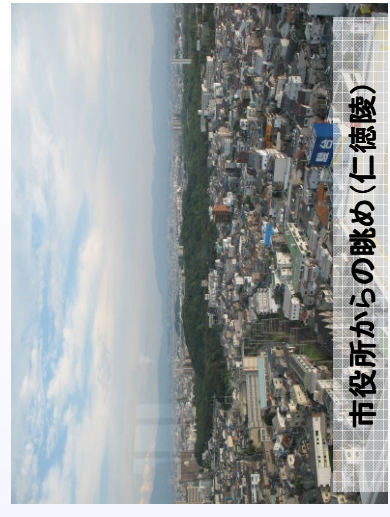
市役所からの眺め(仁徳陵)