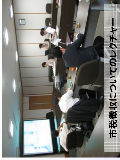
市税徴収についてのレクチャー