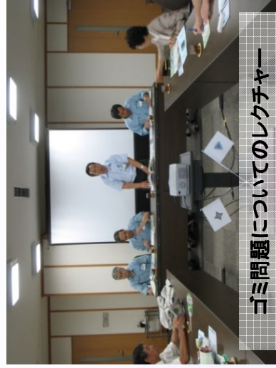
ゴミ問題についてのレクチャー