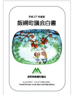
議会の見える化推進

いるため、本会議の一般質問の時には議員と首長の双方に既にセリフ・原稿が決まっていることになりま。だから、本番の本会議では原稿をただ読み上げることに終始します。ただし、質問取りには議員側には一部メリットがあることも事実で、質問や提言を行政側に提示し、やり取りを行う過程で前向きな答弁を引き出し、施策を前に進めることを促しています。一長一短はありますが、思い切って一問一答方式を採用した飯綱町議会の前身力には敬意を表します。