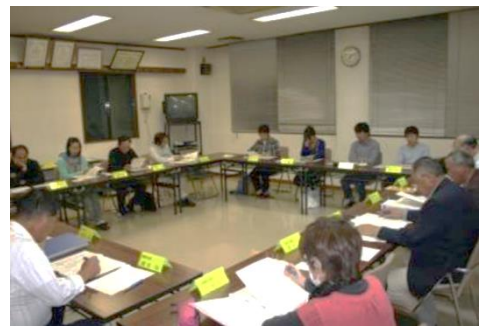
開かれた議会を実現、政策サポーター制度