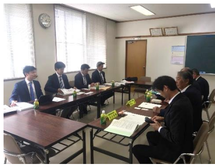
視察の受入れと説明は町議が行う