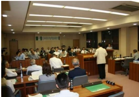
町民に傍聴の機会を広げる夜間議会