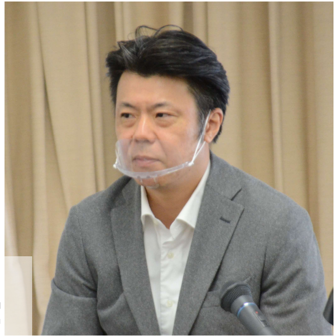
通算9回目となる総括質問