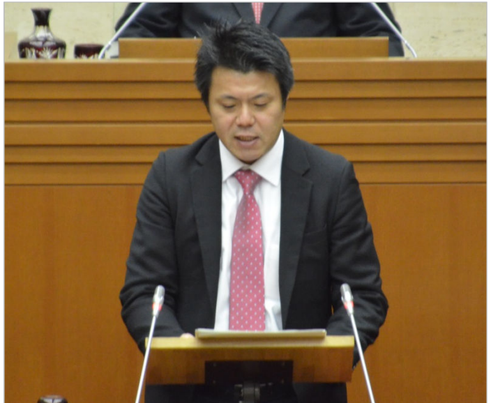
↑3期目では初めての一般質問。継続して取り組んできた防災対策、地域運営学校の設置などの進捗も確認。