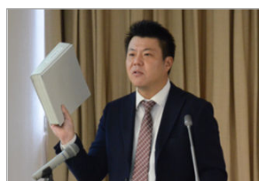
総括質問での質疑

区民の皆様から直接にいただいた要望も取り上げました。学校周辺の防犯カメラの設置、商店街内での危険通行する自転車への対策、東上線踏み切り対策、今後も児童の増加が見込まれる小学校の改築などの改善を求めました。