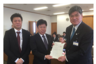
予算要望への回答書

政務調査会の副会長として取りまとめに尽力した区への予算要望に対して回答を区長よりいただきました。要望が反映されたものがありますが、まだ道半ばの取り組みも残っていますが、実現に向けて予算審議に臨んでいきます。