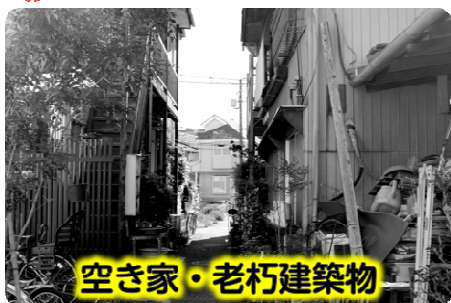
空き家・老朽建築物