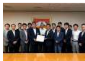
区議団で要望書を届ける

防災、街づくり、高齢者施策、障がい者福祉、受動喫煙の対策、幼児教育・保育の無償化等幅広く区に対して要望を投げかけました。