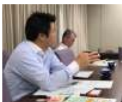
現場に赴き意見交換

小中学校の学区域が完全に一致しており、それを基にコミュニティ・スクールも運営されています。三鷹市の教員は東京都教育委員会から、小学校と中学校の両方の教員としての兼務発令されるなど、先駆的な取り組みは区にも参考となります。