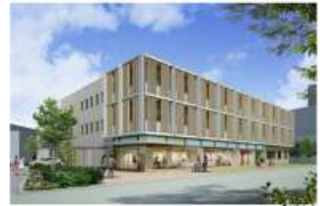
総合支援センターの完成イメージ

令和4年度の開設を目標にして、既に実施設計に入っており、令和2～3年度にかけては建設工事が行われる予定になっております。今年度を含めてあと3か年でしっかりと育成した人員や経験の豊かな人員を確保する必要があります。全体では100人を超える職員数が想定されています。その中でも、特に実際の個別のケースにあたる児童福祉司の育成と確保については必要性が高く、区としては開設時には40名の人員を揃える計画をしています。既に先行的に児童相談所の設置を進めているモデル3区(世田谷・荒川・江戸川区)と職員配置や施設整備の計画を比較してもみると、板橋区が職員配置や施設整備に力を入れていることが分かりま