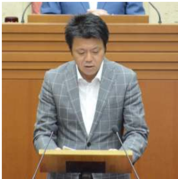
久々の一般質問にて登壇

国が対策を強化する課題について、区の取り組みの促進を求める。 本庁舎周辺の整備計画など、区として抱える課題も質疑を行う。